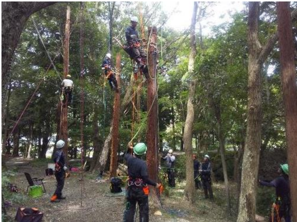
技術向上研修会（ツリークライミング基礎講座 BAT-3）