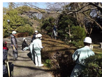
知識技能講習（最終日は美術館園地にて樹木剪定作業）